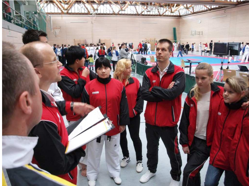
Teambesprechung vor Beginn der Wettkämpfe

Wie immer, startete das Turnier „pünktlich“ mit fast einer Stunde Verspätung. Da beim Ranglistenturnier jedoch überwiegend Bundeskader am Start waren hatten es unsere Sportler sehr schwer. Trotzdem zeigten sie sehr gute Leistungen, konnten aber keine Podestplätze erringen.