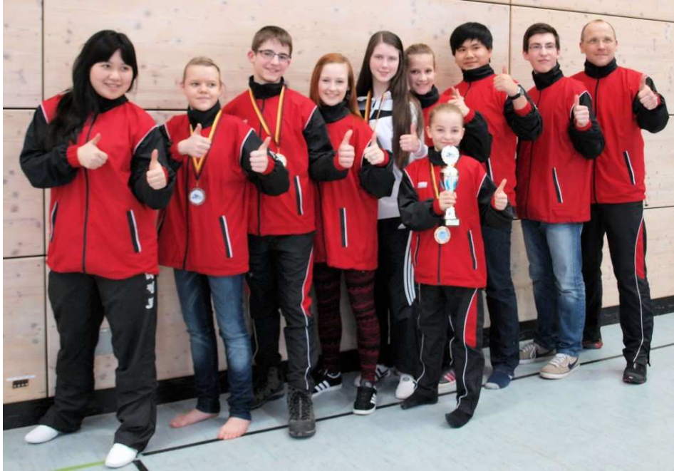
Teilnehmer am Nachwuchsturnier mit Landestrainer und Pokal

Nach bis zu über 400 km Heimfahrt waren die letzten Sportler gegen Mitternacht zu Hause. Die Wettkämpfe haben gezeigt, dass unser Landesverband auf dem richtigen Weg ist und woran in Zukunft gearbeitet werden muss.