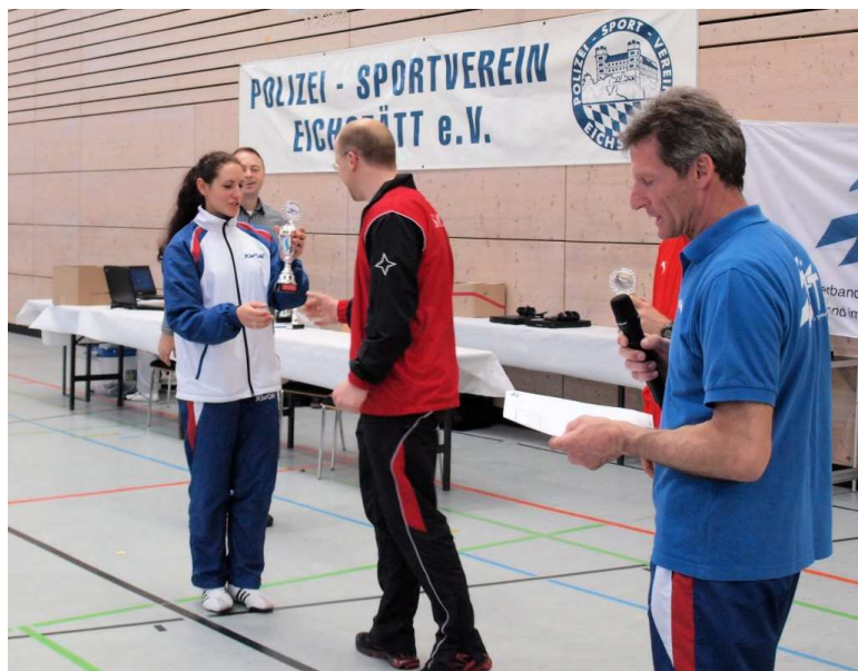
Übergabe des Pokals für den Platz 3 in der Länderwertung

Einzel sowie Victoria einen guten 4. Platz. So ging nach über 8 Stunden für uns ein erfolgreiches Turnier zu Ende, denn am Schluss erreichten wir noch im Nachwuchsturnier einen 3. Platz in der Länderwertung und konnten zusätzlich mit einem Pokal nach Hause fahren.