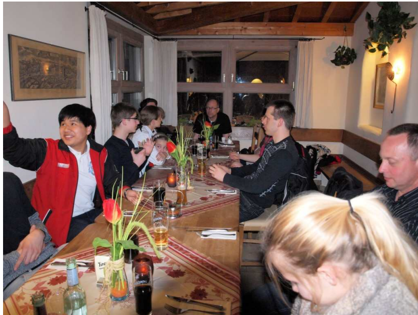
Abendbrot in Eichstätt

Die Anreise erfolgte für die meisten unserer Teilnehmer schon am Freitag und übernachtet wurde in der Jugendherberge in Eichstätt. Nach Ankunft ging es noch zur Registratur und dann zum Abendessen in eine nahegelegene Pizzeria.