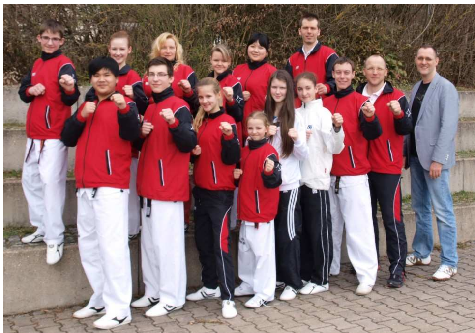
Team Landeskader Sachsen mit Gast aus Thüringen